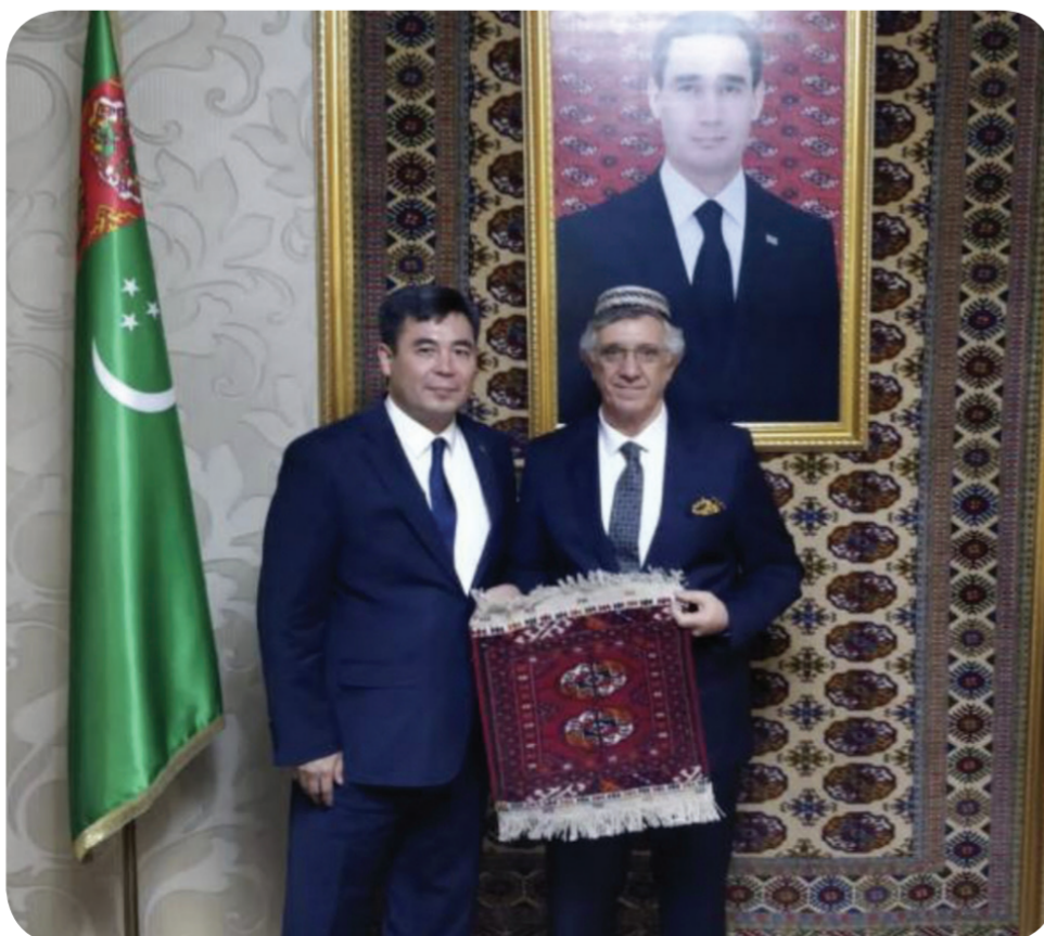
КАБАР: МЕДИАМАНАС

Жолугушууда ректор окуу жайда Түркмөнстандын көбүрөөк студенттерди тартууга, түркмөн элинин тарыхын жана маданиятын жайылтууга чоң маани берилерин айтып, Түркмөнстандын Кыргызстандагы элчилиги менен “Манас” университетинин ортосундагы кызматташтыктын мындан ары улануусун колдоорун билдирди.