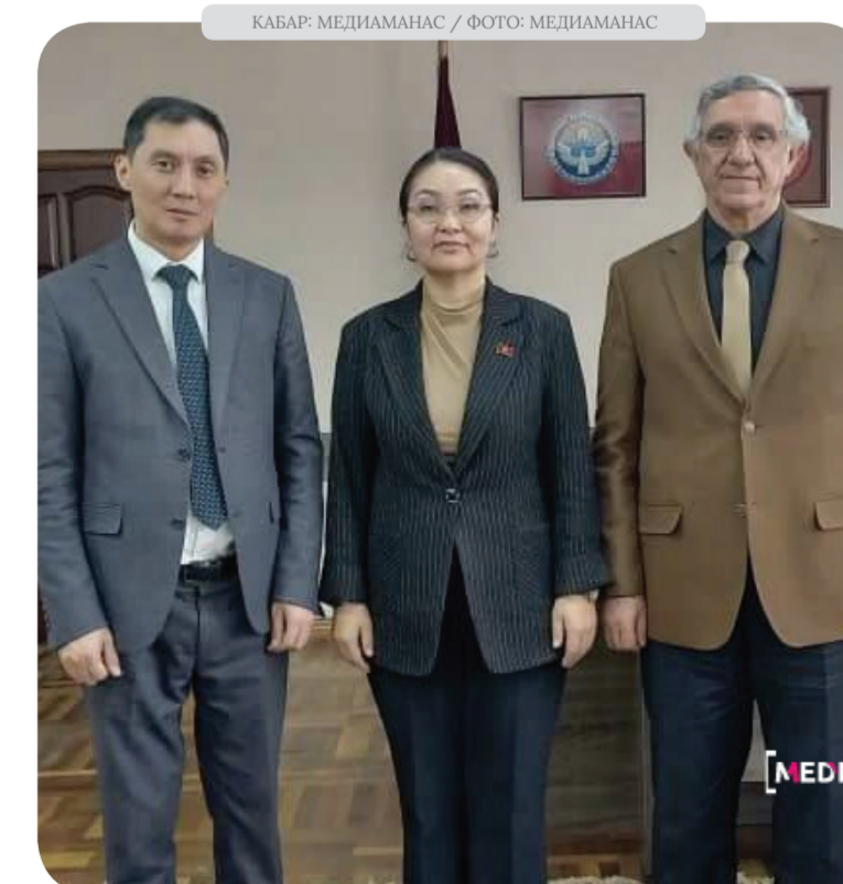
КАБАР: МЕДИАМАНАС

Ректор А. Жейлан «Манас» университетинин негизги миссияларынын бири Кыргызстанга жана Түрк дүйнөсүнө кызмат кылуу Кыргыз-Түрк экенин белгилеп, Түрк дүйнөсүнүн жаштарына татыктуу таалим-тарбия берип, Түрк дүйнөсүнө зор салымын кошуп турган иштерди жүзөгө ашыра беришерин айтты.